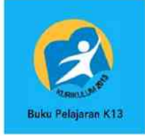
Buku Pelajaran K13