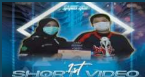
Juara 1 Short Movie Sanus 2020