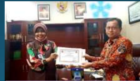
Sertifikat dari BPBD