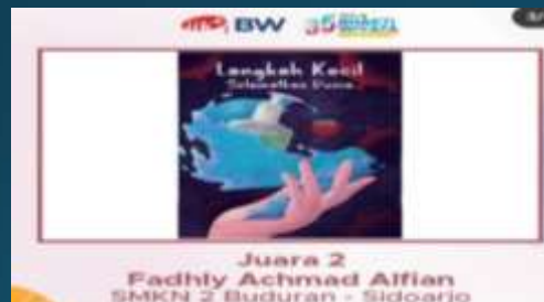
Juara 2 Lomba Poster Kesehatan Se-Jatim 2020