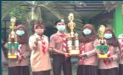
Juara Umum Lomba Pramuka