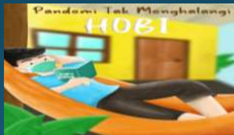
Juara 1 Poster Thema Pandemi