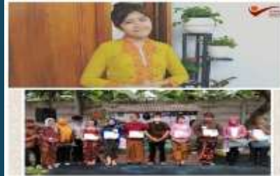
Juara Lomba Langgam Jawa Dekesda