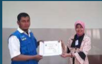
Sertifikat dari Kepala Puskesmas