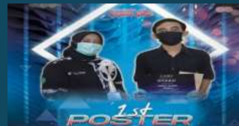
Juara 1 Poster Sanus 2020