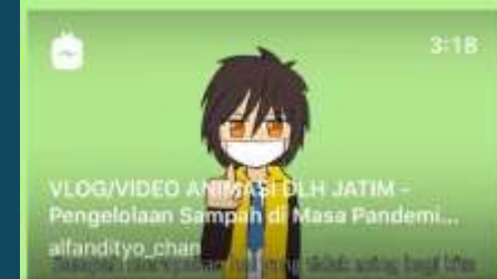
Juara 1 Lomba Animasi DLH Jatim