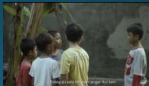
10 Besar Festival Video Edukasi Kemdikbud 2020 "Padu Bersatu"