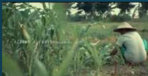
Juara 3 Festival Video Edukasi Kemdikbud 2020