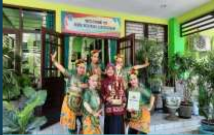
Lomba Tari Komsos Kreatif